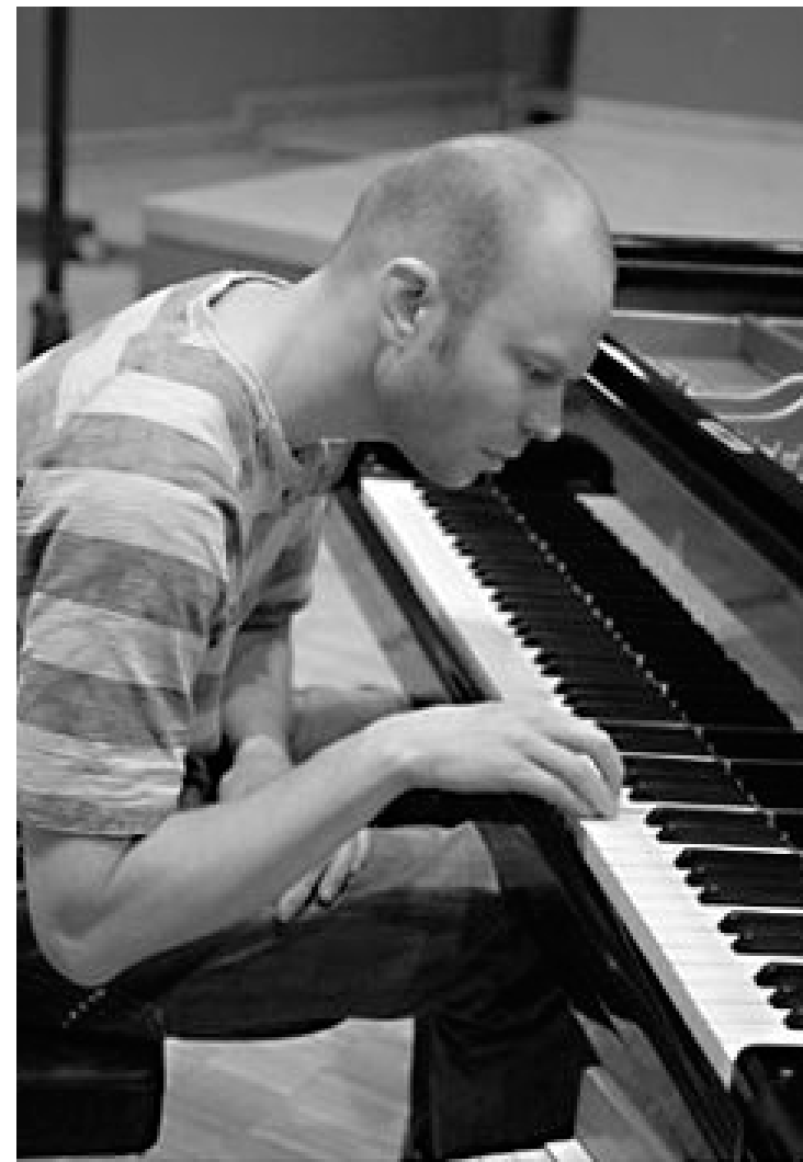
Vår anmelder har sans for Christian Wallumrøds evne til å kombinere ulike stilelementer.