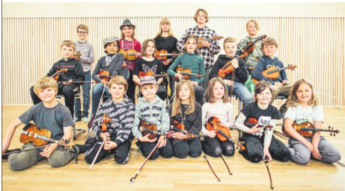
Dragegjengen spelar tradisjonsmusikk med innslag av samtidsmusikk.

Sigbjørn Apeland er musikar, musikkvitar og fast melder i Dag og Tid.